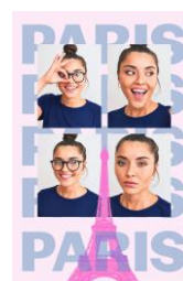
Photo Fun et touristiques